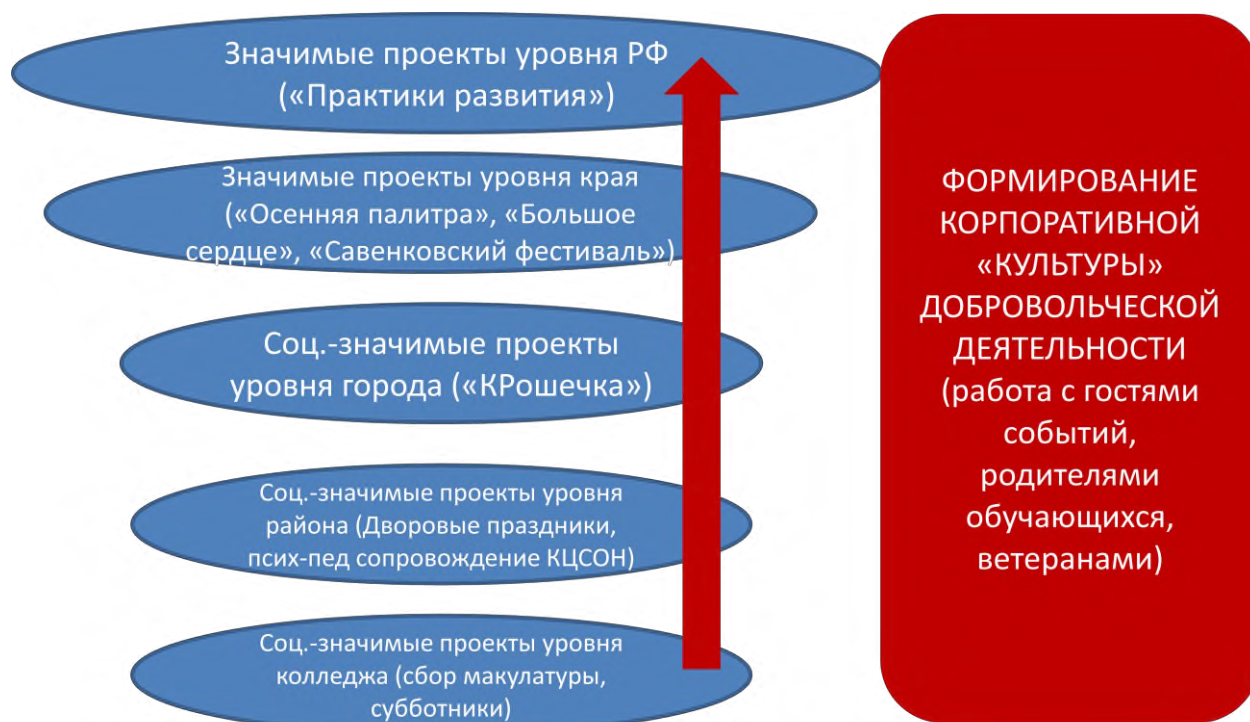
Рисунок 2 Структура цикла

Сущность организации добровольческой деятельности студентов колледжа – создание условий для получения практического социально-значимого опыта и его транслирования в духовно-нравственные ценности. (см.Рис.3).